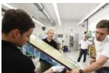
Rizzoli di Milano.

Uno spaccato 'vissuto' che ha scelto e raccontato l'esperienza di sei centri di formazione post diploma biennali in Italia: il Malignani a Udine specializzato in meccanica per l'aeronautica, l'Its Lanciano (Chieti) per la meccanica nel settore automotive, il Giovanni Caboto di Gaeta e il Giovanni Giorgi di Verona per il settore della mobilità sostenibile, per l'area delle tecnologie informatiche per la comunicazione il Fistic di Cesena e l'Angelo